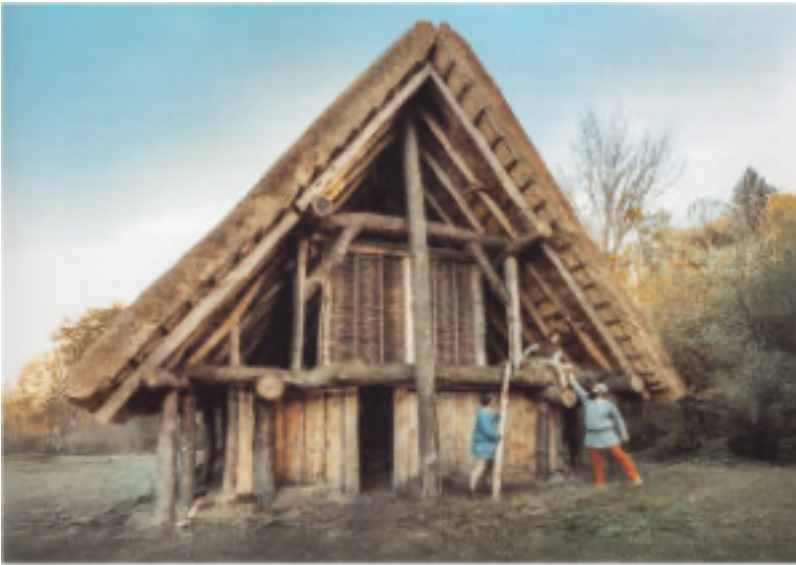
Ein germanisches Langhaus, wie man es auch im Archäologischen Freilichtmuseum in Oerlinghausen sehen kann.

gen Stellen der Kleidung. Dieses war aufgrund der körperlichen Arbeit im Alltag für eine bessere Beweglichkeit notwendig. Tierhaare nutze man ebenfalls zur Wärmedämmung der typischen Langbauten. In diesen Langbauten lebten Menschen und Tiere zusammen natürlich durch Trennwände abgegrenzt. Die Holzkonstruktionen waren handwerklich aufwendig und erforderten eine beachtliche Menge an Eichenholzbalken. Das nahezu authentisch nachgebaute Langhaus in Oerlinghausen besteht aus 195 Eichenstämmen. Beim Hausbau wurden schnell mal bis zu 70 Stammesmitglieder gemeinsam aktiv. Generell pflegten die Germanen den „Müßiggang“. Sie waren nicht auf wirtschaftliche Überproduktion ausgerichtet. Jegliche für den Lebensunterhalt notwendige Beschaffung aus der Natur als Jäger und Sammler richtete sich in erster Linie nach dem Eigenbedarf der Kolonie.